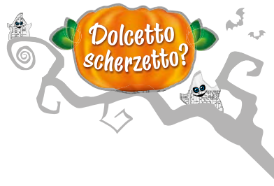
Halloween 2013 Kinder FERRERO: Cliente Ecco - FERRERO. Realizzazione marchio, illustrazione ed applicazione.