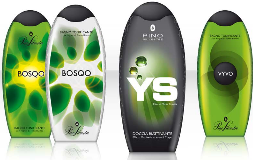
Pino Silvestre MAN: Cliente Libera - W&J. Progettazione visual partendo da volume esistente.