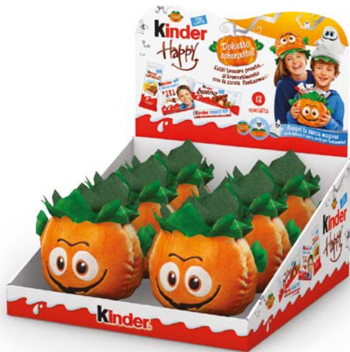
Kinder Zucca Fantasma Expo Halloween