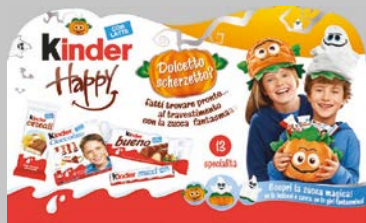
Kinder Zucca Fantasma Crownner Halloween